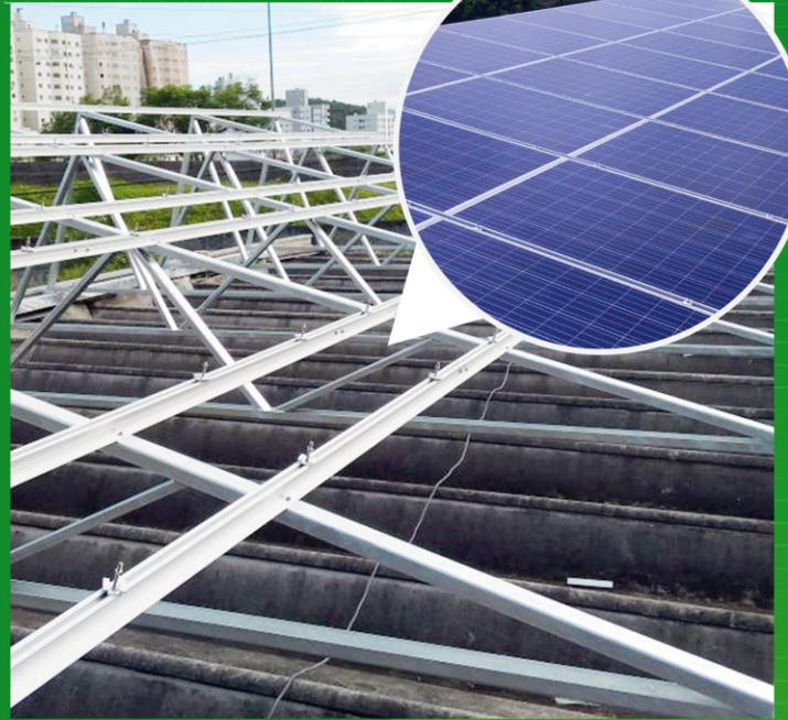
Aplicação com perfis com abas