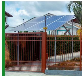
Estruturas para garagem