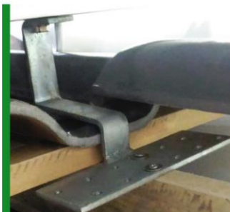
Suporte para telhado cerâmico