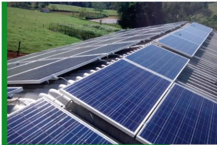
Aplicação em telhado ondulado