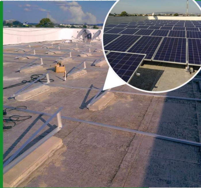
Estruturas triangulares em terraços

Confira algumas das possíveis soluções em sistemas de fixação de estruturas e de MFV disponibilizadas pela ALU-CEK.