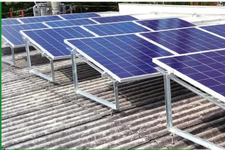
Estrutura em telhado fibrocimento