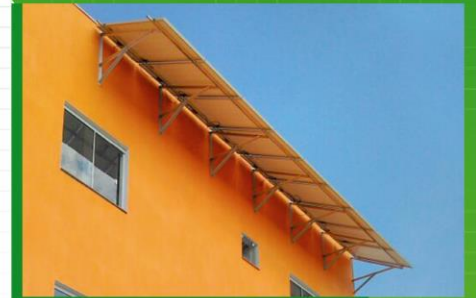
Estruturas para paredes e fachadas