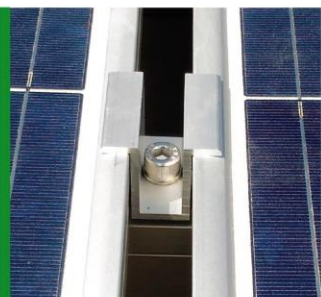
Fixação por presilhas centrais