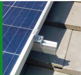
Fixação por presilhas laterais